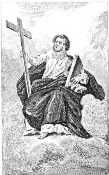
SAN FELIPE .

Desde allí ha de venir á predicar á los vivos, y á los muertos .